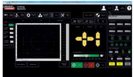
ACCUMOVE mit CAD CAM